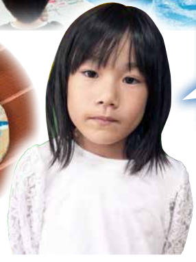
かめの ひなたさん