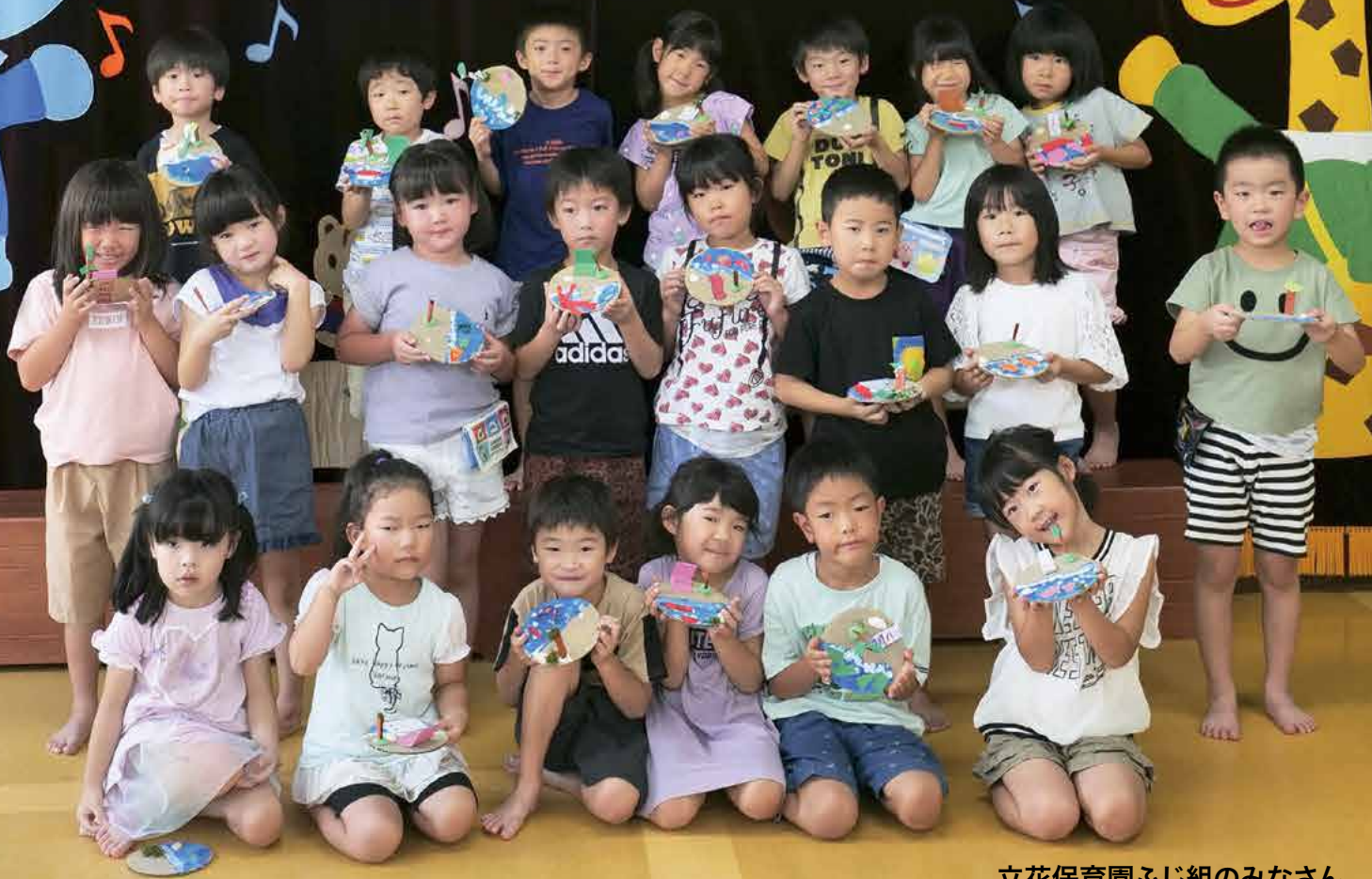
立花保育園ふじ組のみなさん